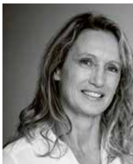
PAR SYLVIE PERES Dermatologue

« IL EST IMPORTANT POUR MOI DE REPARTIR DU SERMENT D'HIPPOCRATE, 'PRIMUM NON NOCERE', EN PREMIER NE PAS NUIRE.